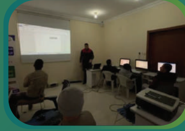
صيانة الحاسب الآلي بالتعاون مع جمعية التنمية الأهلية بالروضة