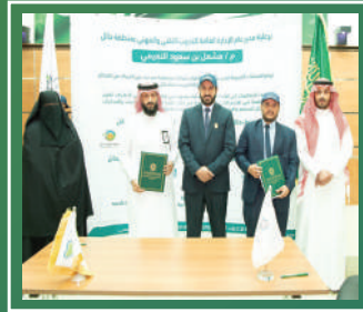
إتفاقية تعاون الكلية التقنية