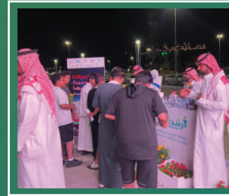
اليوم العالمي لمكافحة المخدرات