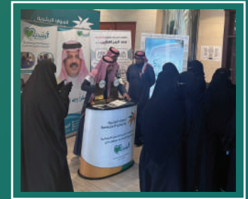
مشاركة مركز التنمية الاجتماعية بعنوان ( اضرار المخدرات وأثارها على الفرد والمجتمع )