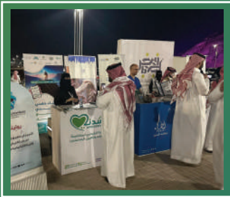
مشاركة اليوم العالمي للعمل الانساني