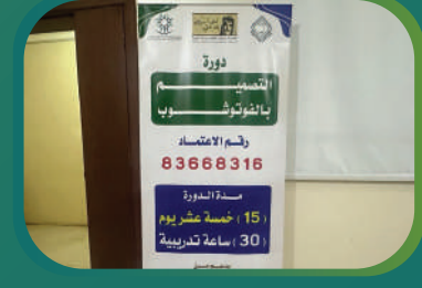
دورة تعلم الفوتوشوب بالتعاون مع جمعية التنمية الأهلية بالروضة