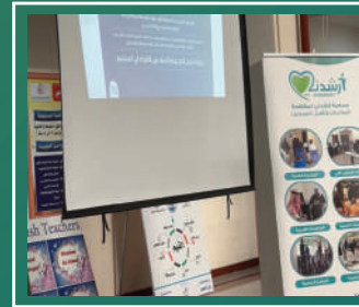
مبادرة ( نية ) بالمتوسطة العاشرة للبنات