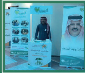
مشاركة برنامج الحماية الاجتماعية في مركز التنمية الاجتماعية