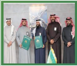
إتفاقية تعاون أمانة منطقة حائل