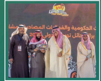
مشاركة رالي حائل تويوتا الدولي